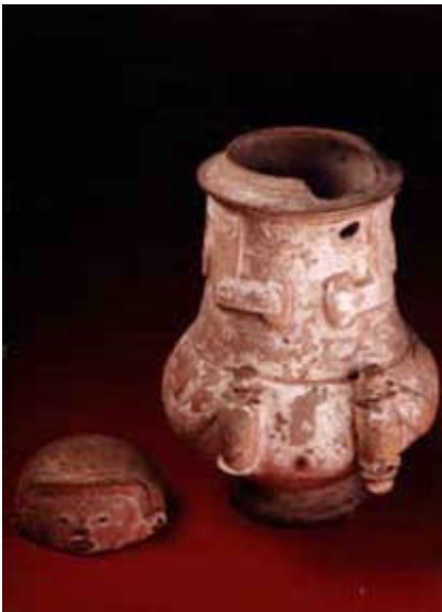
Urnas funerárias indígenas para guardar cinzas (ilustração)

O Departamento Histórico do Estado de São Paulo iniciou um projeto arqueológico nos principais pontos da cidade. Dentre esses pontos foi encontrado no Cemitério da Quarta Parada uma urna indígena. Esse e outros materiais estão expostos no Sítio Morrinhos na Rua Santo Anselmo, 102, no Jardim São Bento. A visitação pode ser feita de terça a domingo das 09:00 às 17:00. A entrada é franca. Para maiores informações pode ligar para o local : (11) 2236-6121.