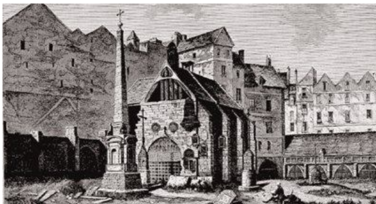
A área de sepultamentos em Paris, bem no meio da cidade Cemitério dos Inocentes, gravura, autor desconhecido, século XVIII

Nem sempre, porém, o cemitério medieval foi seguro. Alguns combates entre inimigos locais chegaram a ocorrer, como violentas brigas de vizinhos e duelos. Ademais, quando faltava vigilância, o cemitério tendia a se transformar rapidamente em depósito de lixo, outro desafio que a Igreja tentou enfrentar com proibições e pragas – dizia que os que urinavam ou defecavam nos túmulos seriam acometidos por doenças.