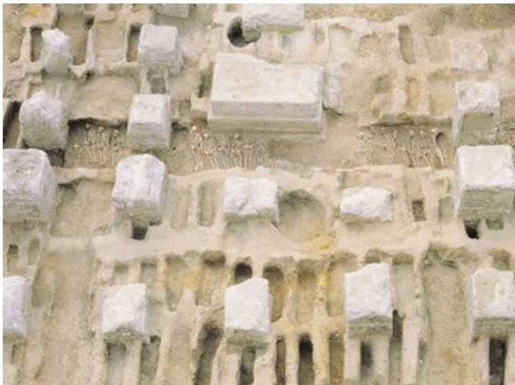
O que restou do cemitério medieval inglês The East Smithfield Black Death

No fim da Idade Média, a Igreja romana legislou para expulsar todas as atividades que perturbassem a quietude dos lugares. Foi proibida a venda de pão, aves, A Via Ápia (à esq.), estrada onde se instalavam as necrópoles na Antigüidade romana peixes e outras mercadorias, com exceção de velas.